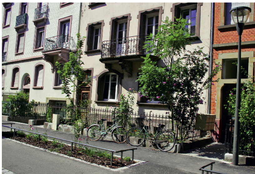
Dans ce quartier de faubourg, un frontage privé permet d'installer un seuil, des marches, des boîtes aux lettres, des plantations, et lorsque les immeubles disposent d'une cave, de créer un accès direct, une ventilation et un éclairage naturel à celle-ci.