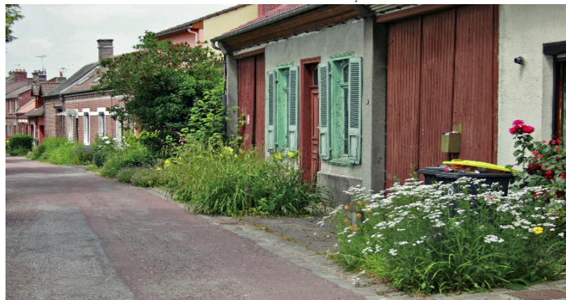
Dans cette rue réaménagée, le projet a pris soin d'offrir une bande en pied de façade. Celle-ci est au départ gérée par la commune mais chaque riverain est invité à prendre le relais, à planter, à gérer et à prendre soin de cet espace.

Concepteurs : A Ciel ouvert - DDE80