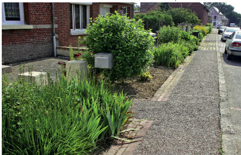
Au départ, dans cette rue, les constructions ne sont pas alignées -les plus en retrait se retrouvent cachées sur cette photo- et les limites privées ne sont pas toujours affirmées. Les plantations sur espaces publics permettent néanmoins d'organiser clairement l'espace et d'offrir un cheminement accompagné d'une bande accueillant diverses fonctions (boîtes aux lettres, encombrant, raccordement des seuils).

Concepteurs : À ciel ouvert