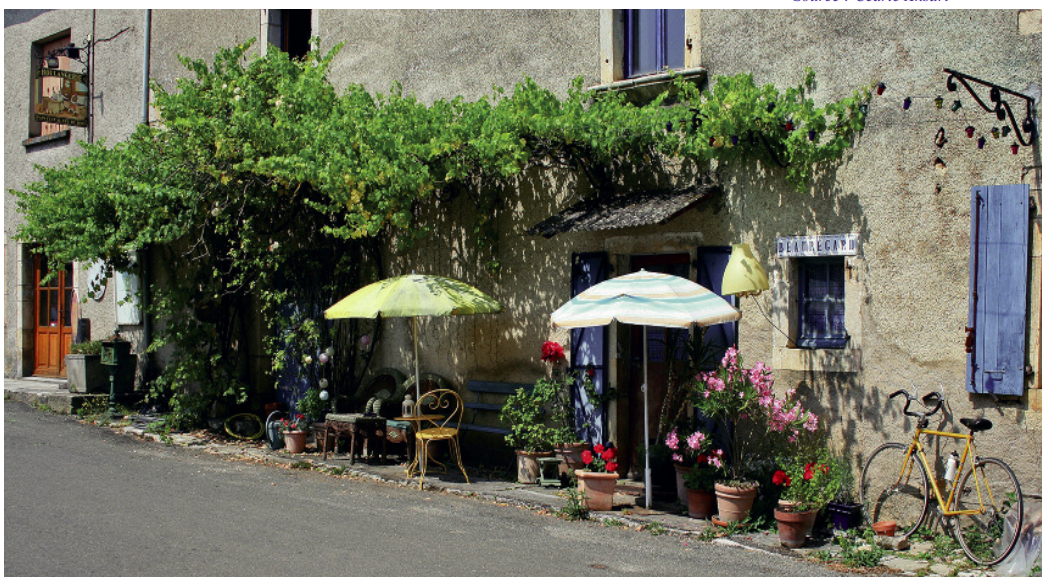
L'occupation riveraine témoigne du caractère habité des lieux et offre des signes de vie locale forts. Même s'ils ne sont pas physiquement présents, cette occupation évoque une présence possible de riverains, de passants ou de piétons éventuels.