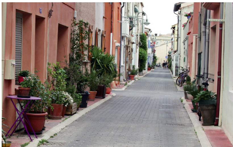
Au départ, les pieds de façade étaient trop étroits et peu praticables -marches, débords- pour que le piéton y chemine confortablement et celui-ci se positionnait spontanément à distance des façades. Chaque riverain a investi cet espace étroit de manière réversible, confortant le fonctionnement intuitif de la rue et les pratiques du piéton.