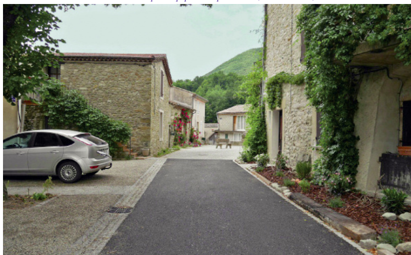
Dans cette rue en zone de rencontre, les riverains disposent de seuils et d'espaces de plantation en limite de propriété, si bien que la chaussée ne s'étend pas totalement de façade à façade et est un peu plus resserrée.

Nicolas Soulier / Concepteur équipe municipale de Vesc, b.e.t. T. Baudet, Mme C. Berne