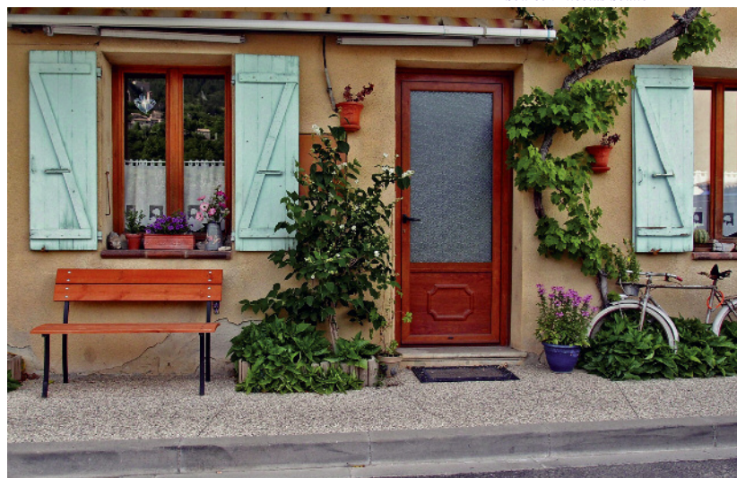
Dans ce village, les riverains occupent directement le pied de façade: banc, plantations, seuils sont installés sur le trottoir plutôt que dans un espace privé séparé. Dans ce cas, chacun doit être sensible au fait de permettre un cheminement piéton dans de bonnes conditions et manifester une attention particulière aux personnes à mobilité réduite.

Concepteurs : A Ciel ouvert - DDE80