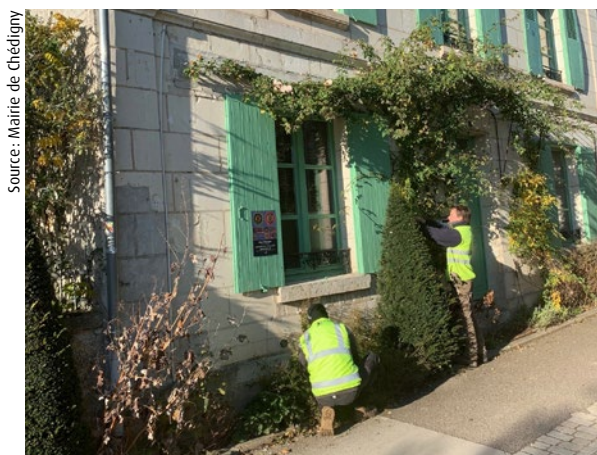
Jardiniers de la commune à l'œuvre

Concernant l'entretien des plantations présentes sur l'espace public, la municipalité avait initialement imaginé impliquer les riverains. Au bout d'une période d'essai, elle décide de reprendre la main. En effet, la taille des rosiers et des arbustes nécessite un savoir-faire spécifique. Le rajout ou le remplacement de plantations (choix des espèces, des couleurs) doit s'inscrire dans une harmonie d'ensemble avec le souci d'adapter les végétaux aux sols et aux expositions ; les interventions doivent être continues et régulières tout au long de l'année. Ce sont donc des employés communaux qui assurent la gestion des espaces verts. L'équipe est constituée d'un chef jardinier, d'un agent à plein temps et d'un autre à mi-temps.