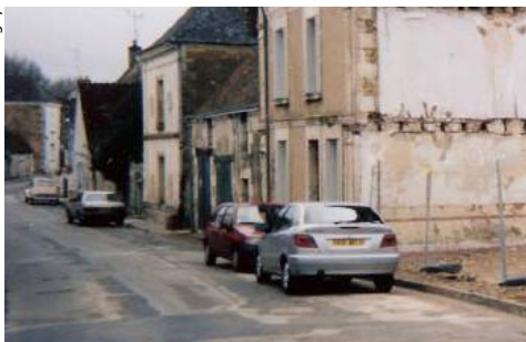
▲ Rue du Lavoir « Avant »