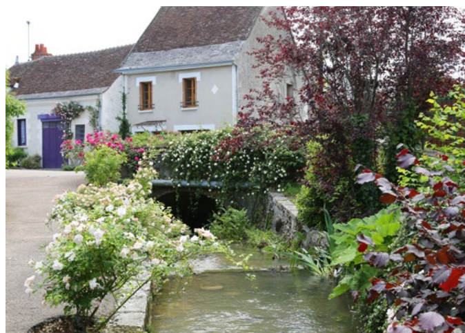
Ruisseau d'Orfeuil : eau et végétal amènent de la fraîcheur et rajoutent de la sérénité aux lieux

Les aménagements paysagers de Chédigny, marqués par la forte présence végétale, n'oublient pas de valoriser les points d'eaux qui eux aussi sont sources de bénéfices environnementaux et influent sur la qualité de vie du bourg.