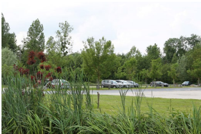
Vaste parking en entrée du bourg. Les visiteurs sont invités à y stationner et à poursuivre à pied

Fléchés et gratuits, ces parkings permettent notamment d'accueillir les nombreux visiteurs. Les jours de manifestations festives importantes, 500 places supplémentaires sont proposées sur des terrains ouverts à ces occasions.