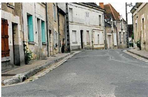
▲ Rue du Lavoir « Avant »