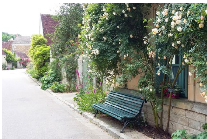
En pied de façade, rosiers et vivaces. Mais aussi des bancs

À Chédigny, l'aménagement des frontages a commencé par la plantation de rosiers grimpants sur les trottoirs, en pied de façades. Celle-ci s'est faite avec la collaboration du rosériste André Eve, spécialisé dans la conservation et la redécouverte des roses anciennes.