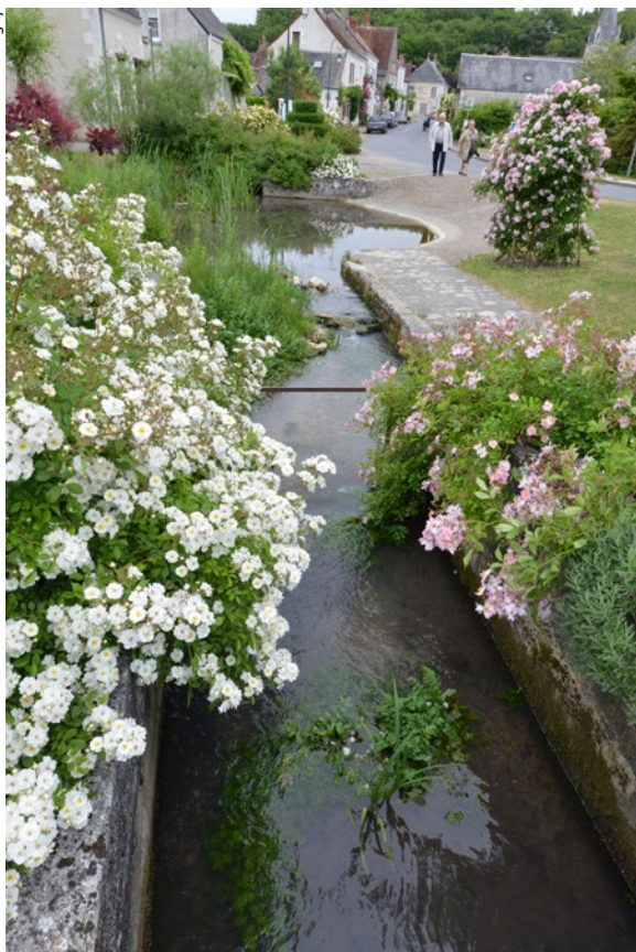
Entrée principale au sud. Mise en valeur de l'ancien abreuvoir qui devient un événement remarquable en entrée de bourg

Fort de son expérience et soucieuse de renforcer la cohérence de sa politique d'organisation des mobilités et d'aménagement des espaces publics, la municipalité met en place en mars 2014 une commission « Aménagements et sécurité du bourg et de ses hameaux ».