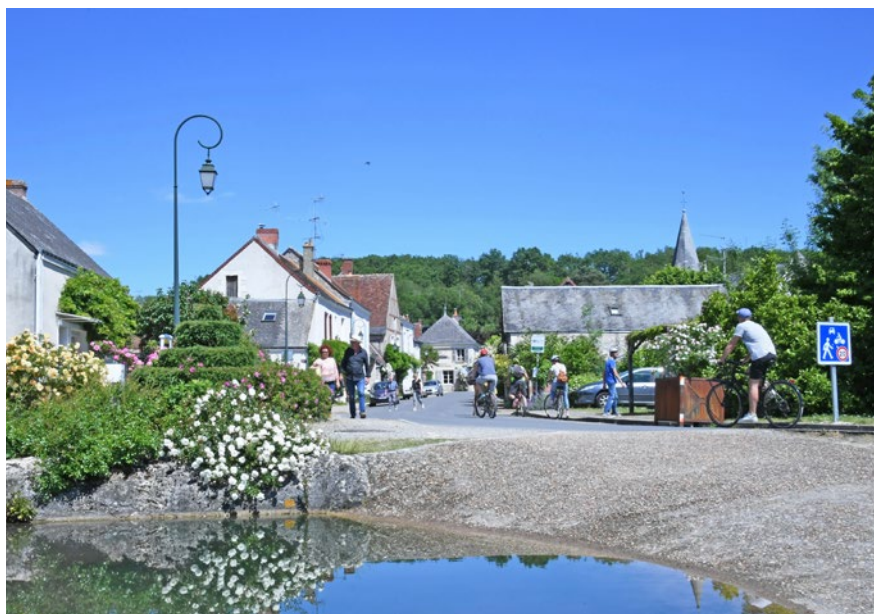
▲ Rue Chante l'Indrois « Après »