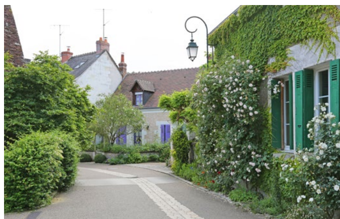
Une végétation en abondance, des bénéfices environnementaux

La réduction induite du trafic motorisé et la reconquête de l'espace urbain par les modes actifs (piétons et cyclistes) favorise la réduction de l'empreinte carbone.