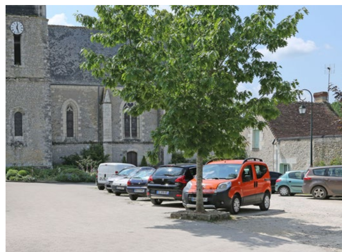
Places de stationnement proposées près de la place de l'église

Sur la place de l'église, près de la mairie, de la salle des fêtes et de l'école, un petit parking, gratuit, propose une vingtaine de places de stationnement. À noter que ces places sont non revêtues (emploi de graves naturelles locales), contrairement au parvis de l'église, juste à côté, qui lui est réalisé en pavés. L'imperméabilisation totale de la place est ainsi évitée et le coût total est moindre.