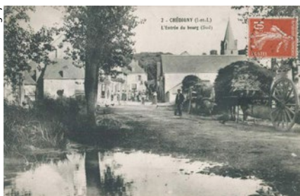
▲ Rue Chante l'Indrois « Avant » ▼